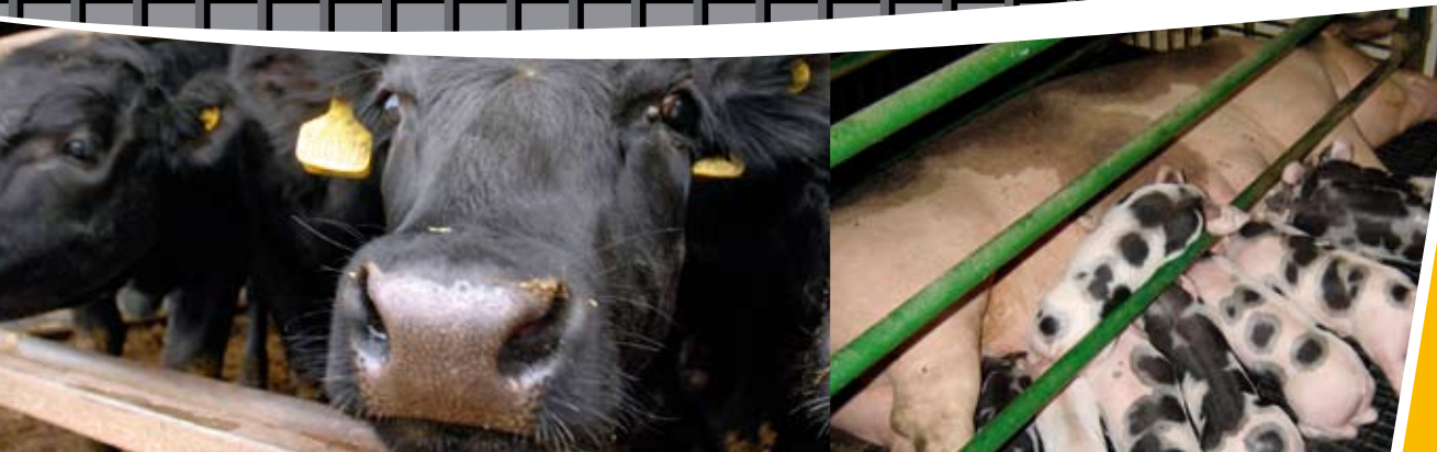
Die Bedingungen, unter denen Tiere in der Massentierhaltung leben müssen, sind nicht hinnehmbar.